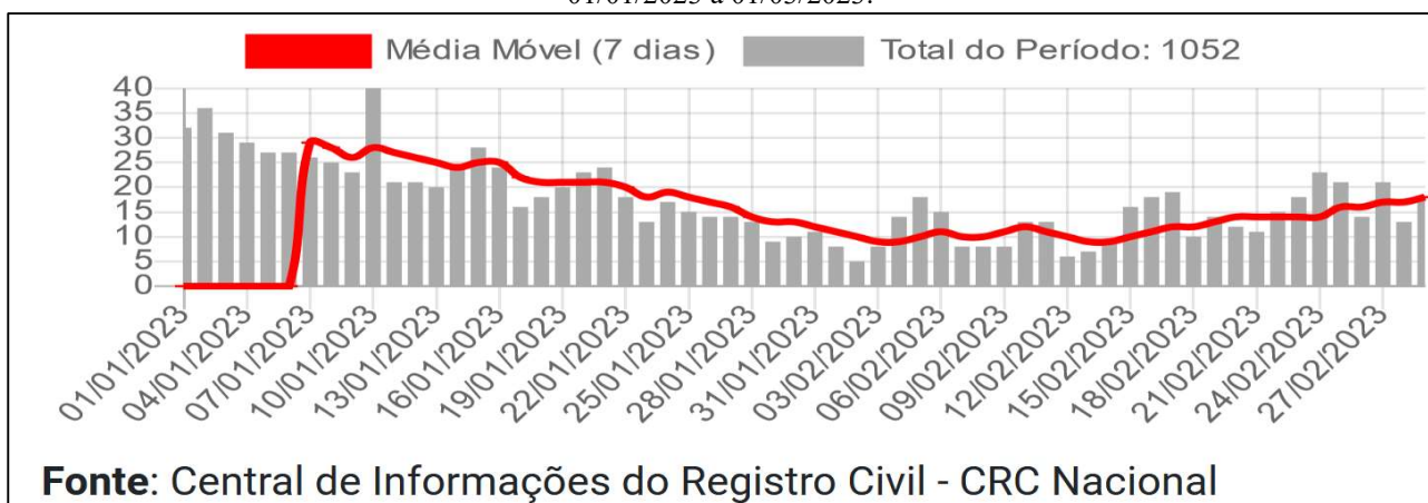
Figura 1 Registro civil de óbitos suspeitos ou confirmados por Covid-19 no Estado de São Paulo. 01/01/2023 a 01/03/2023.

Esse achado está concordante com o crescimento do número de novos casos de SRAG notificados nas semanas mais recentes, até 06/03/2023, informado pela Fundação Oswaldo Cruz (Fiocruz) a respeito do Estado de São Paulo ( https://portal.fiocruz.br/documento/boletim-infogripe-semana-09/2023 ).